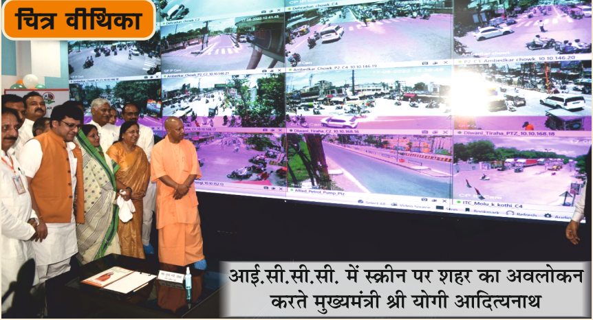
आई.सी.सी.सी. में स्क्रीन पर शहर का अवलोकन करते मुख्यमंत्री श्री योगी आदित्यनाथ